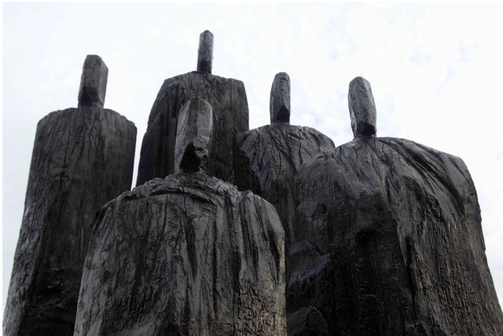
Christian Lapie, « L'écho des ombres », chêne traité (détail)

AVEC POUR INVITÉE EXCEPTIONNELLE : IRÈNE FRAIN