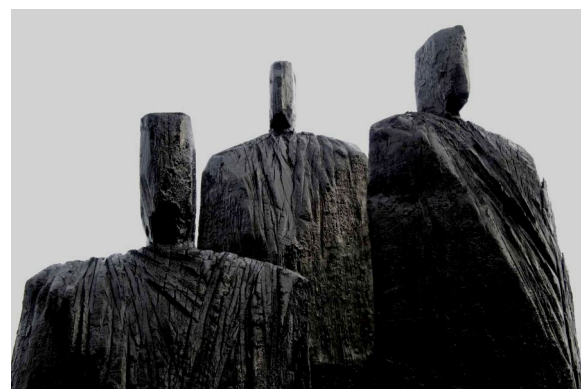
Christian Lapie, « L'écho des ombres », chêne traité (détail)