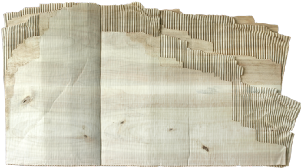
Christian Renonciat, Large carton paysage , 2021, peuplier, 79 x 139 x 6 cm

du 19 novembre 2021 au 15 janvier 2022 du mardi au samedi de 14h à 19h, fermé du 24 décembre 2021 au 3 janvier 2022